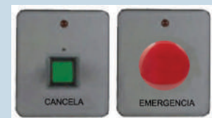
Instalación en poliductos